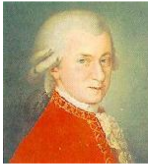
WOLFGANG AMADEUS MOZART (1756 - 1791)

- Este ser “especialíssimo” correspondia exatamente a 1/49 da divindade na face da terra. Mozart vibrava exatamente como a tônica (RAIO) das artes (MÚSICA) do 6º senhor , sendo ele a síntese de Bach, Beethoven e Wagner (partes mais fragmentadas da divindade), representando a “música do 6º senhor na face da terra”.