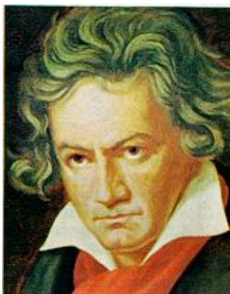
LUDWIG VAN BEETHOVEN (1770 - 1827)

- Este ilustre e enigmático ser foi considerado por muitos o “herói dos heróis”, com um imenso coração (romântico) e incompreendido em sua época, deixou para as gerações futuras um imenso legado de sabedoria através de sua música. Beethoven musicava a cosmogênese, cada nota e cada espaço de sua sublime música entoava a formação dos mundos (RAJAS - 2º TRONO), vibrava com a tônica do 6º senhor (vida esparsa). Muitos dizem que a quinta sinfonia (aquela que qualquer mortal já ouviu pelo menos uma vez) é um aspecto do 5º senhor expressado pela revolta e sublimação contida em sua música. Com a descida de Mozart, alguns pensadores concluem que a retomada da música espiritual do 6º senhor foi passada para Beethoven, que possuía um veículo apropriado para a missão.