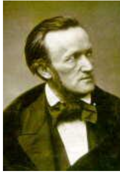
RICHARD WILHELM WAGNER (1813 - 1883)

- Foi o compositor que musicou a Antropogênese, representada através de suas óperas, os aspectos da polaridade do ser humano. Wagner vibrava com a tônica do 5º senhor, (TAMAS - 3º trono). Era do sígno de Gêmeos, elemento ar, com domicílio em Mercúrio (planeta do 6º senhor). Ele se inspirava nos Eddas , que são os Vedas da Escandinávia, trazendo os mitos de “Parsival, Lohengrin, Tannhäuser, etc” em suas obras. Wagner era ocultista e mitólogo, pois bem sabemos que atrás de um mito, para quem tem “olhos para ver”, sempre existe uma verdade oculta (GRAAL - Parsifal).