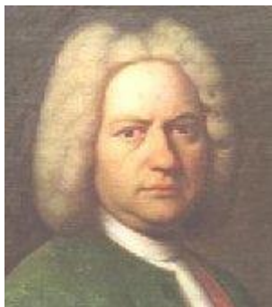
JOHANN SEBASTIAN BACH (1685 - 1750)